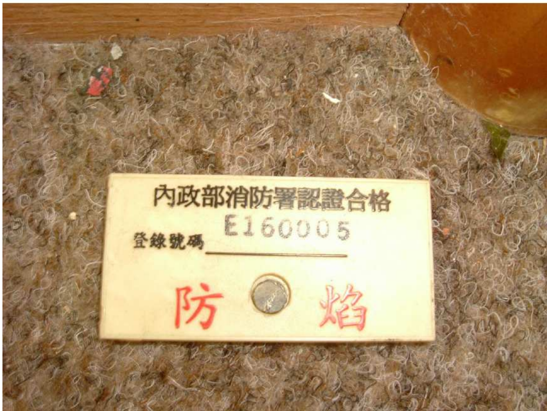
【全部採用合格防燄材質】