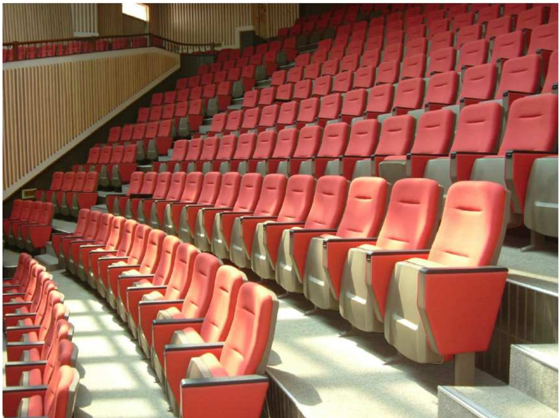
【座位約為 616 人】