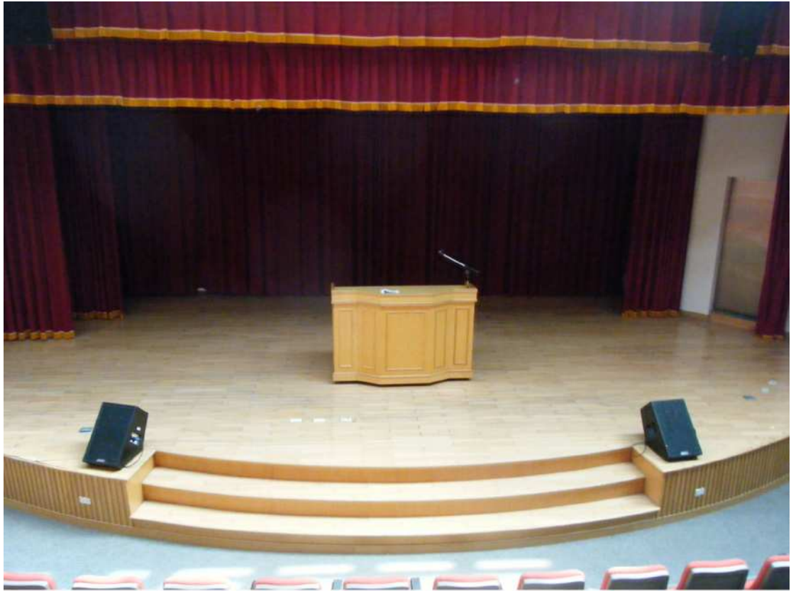
【舞台、演講台、燈光設備】