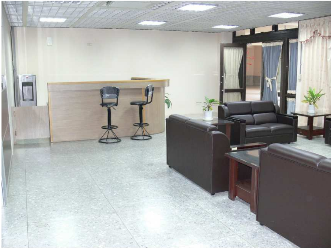
【貴賓室設置有吧台】