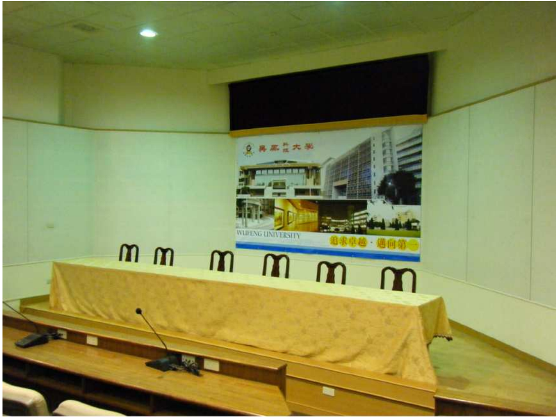
【備有投影設施、演講台及兩旁同步撥放】