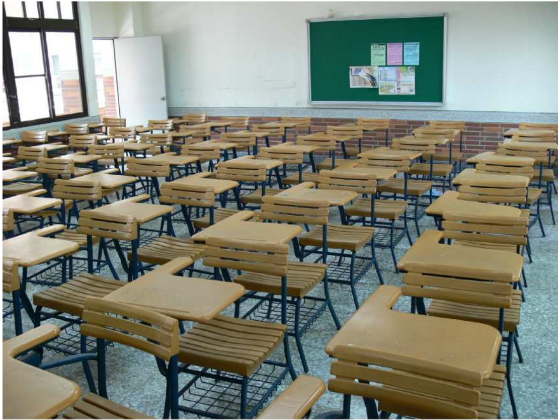
【採光良好、座椅新穎】