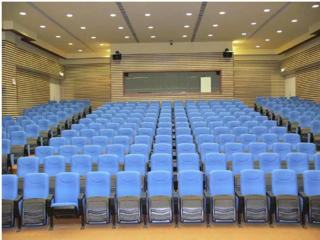
【座位約為 238 人】