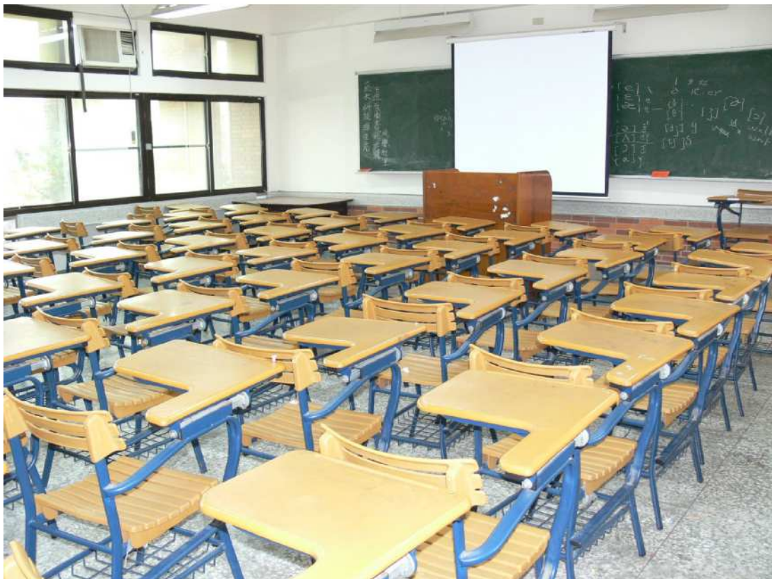
【可投影教學、有冷氣設備】