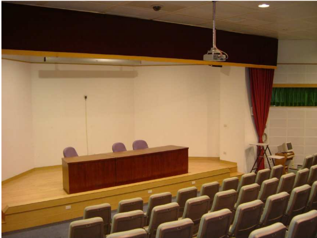
【講台、電腦投影設備】